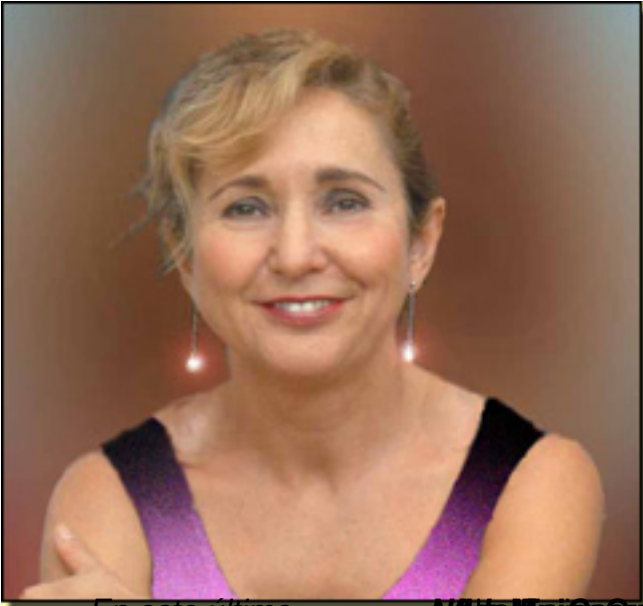
En este último

Martes, 09 de Marzo de 2010 20:38 - Actualizado Jueves, 06 de Mayo de 2010 09:49