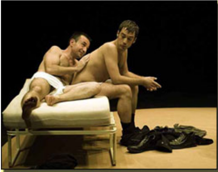
Tíos Vivos es

- Queremos redefinir nuestra versión de la obra de