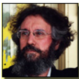
José Ramón Díaz Sande Copyright©diazsande

Y volvamos al principio: los 12.000 Euros. Cuando la función acaba al reclamo de los aplausos, no acuden los actores. Ya lo había advertido nuestro narrador:” no por querer ser originales o soberbios, sino porque no queremos dar un producto de consumo, que es lo propio del poder”. Al iniciar nuestras levantadas, “uno” - pensábamos que la función continuaba - coge una de las tizas y sobre la pared negra escribe: “devolved la subvención”. Pronto entendimos que no era un quinto actor sino un joven espectador muy indignado por la incongruencia del grupo teatral “la república” (el acento es así: ù, no me lo cambien). Su razonamiento, al hablar con él, es que si atacan a quien les da de comer (poco pueden comer con 12.000 Euros) - La Consejería de Cultura y Gobierno de la Comunidad de Madrid -, ese dinero hay que devolverlo. Y aquí surge mi perplejidad: todavía hay en España ciudadanos que piensan que el dinero de las subvenciones es de los políticos o del partido que está en el poder. Lo malo es que algunos de esos políticos o gente del poder, se creen que el dinero es suyo. No se han enterado que todos los ciudadanos de todos los colores pagamos impuestos para las tales subvenciones. ■