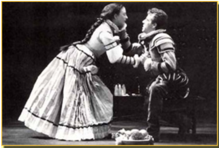
NURIA GALLARDO/CHEMA MUÑOZ

■ El affaire Bill Clinton es un juego de niños, comparado con las maléficas intenciones que guían a Sancho IV el Bravo (hijo de Alfonso el Sabio ), dominado por el “fuego en las entrepiernas”, como advierte