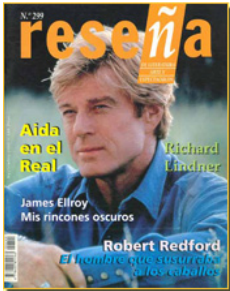
RESEÑA, 1998 NUM, 299, pp. 33