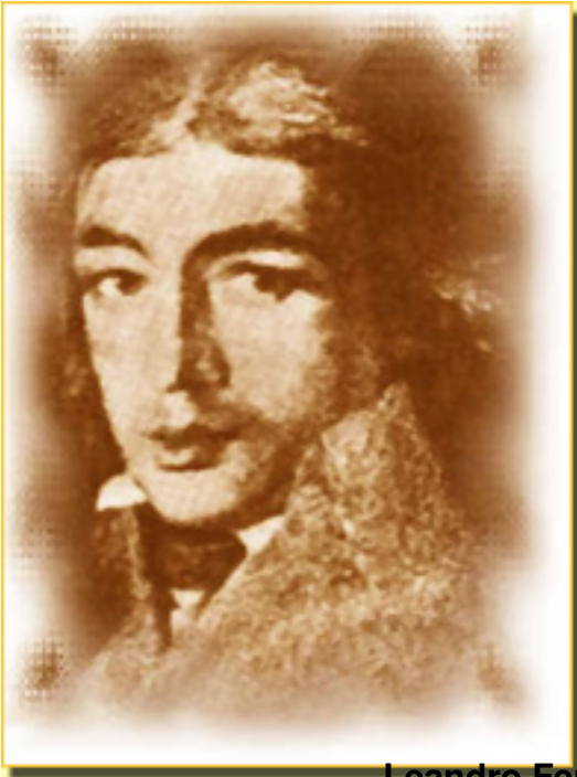
Leandro Fernández de Moratín, FERNÁNDEZ DE MORATÍN, Leandro Moratín

Sábado, 20 de Marzo de 2010 18:42 - Actualizado Sábado, 10 de Julio de 2010 16:26