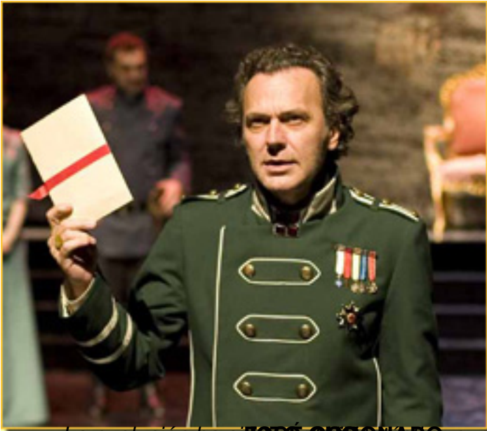
La evolución ha sido un proceso de purificación

Sábado, 20 de Marzo de 2010 18:11 - Actualizado Martes, 06 de Julio de 2010 15:24