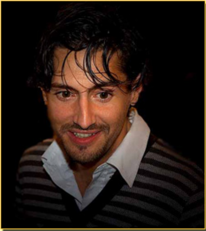
JUAN DIEGO BOTTO

Sábado, 20 de Marzo de 2010 18:11 - Actualizado Domingo, 31 de Mayo de 2020 16:18