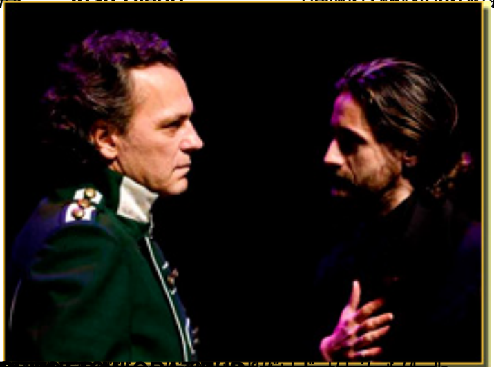
el tiempo con el que se