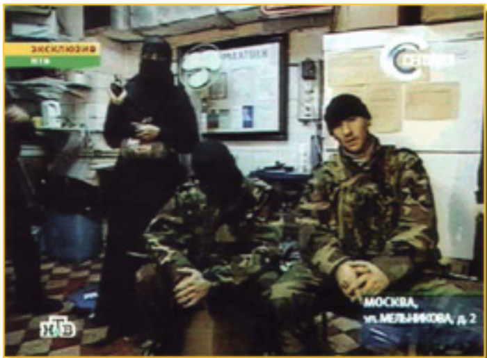
25 DE OCTUBRE, NTV, entrevista con los asaltantes y con MOVSAR BARAYEV

Los 900 espectadores – 800 según otros datos - son retenidos como rehenes durante dos días y medio. Los chechenos exigían la salida de las tropas rusas de Chechenia. Tres días de negociaciones y acaba con la intervención de las fuerzas especiales rusas, utilizando gases que acabaron con la vida de asaltantes y buena parte de rehenes. Analistas de todo el mundo – el Kremlin ha mantenido silencio – aseguran que el gas utilizado es el llamado “gas nervioso”, el cual es de una gran toxicidad, provocando, según la dosis, la muerte. Se trata de arma prohibida por las convenciones internacionales. Con posterioridad el acto fue reivindicado por el caudillo checheno Movsar Barayev .