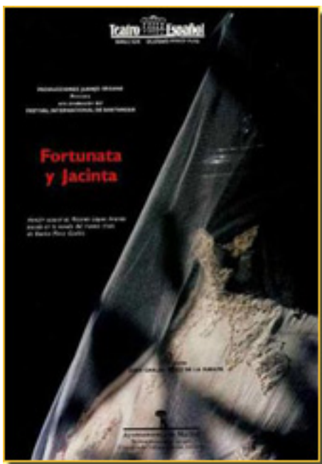
FORTUNATA Y JACINTA (TEATRO ESPAÑOL, 1994)

- Entonces ya nos plantea López Arandía dificultades de la puesta en escena de una novela que trata