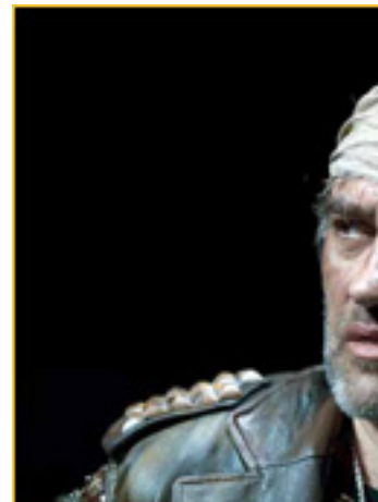
MACBETH, EL REY DE ESCOCIA, EN SU PALACIO DE DUNDEE