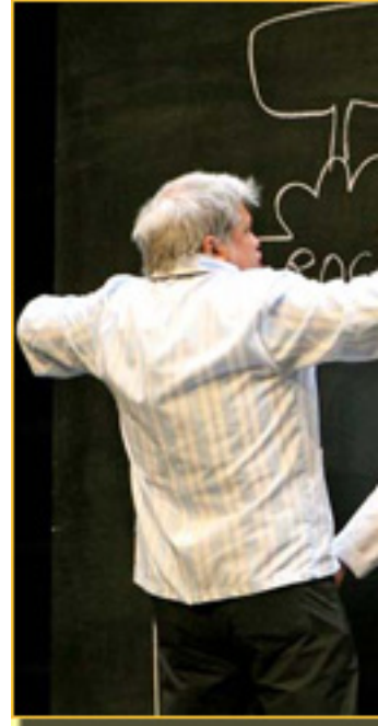
Triciclo