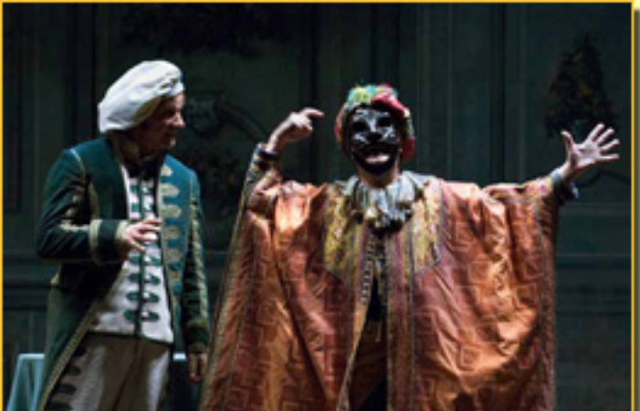
EL TIEMPO DE LOS... UN TIEMPO DE LIBERTAD... EL TIEMPO DE LOS... el tiempo de los abuelos