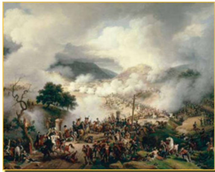
BATALLA DE SOMOSIERRA, 1810 LOUIS FRANÇOIS LEJEUNE

Este proyecto es realizado por el Ayuntamiento de Madrid, en colaboración con el Ministerio de Cultura y el Ayuntamiento de Madrid.