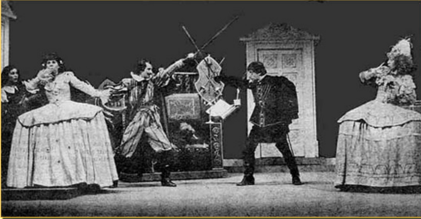
CASA CON DOS PUERTAS □ (ANTIGUA VERSIÓN DE LA COMPAÑÍA)

Sábado, 13 de Marzo de 2010 08:58 - Actualizado Jueves, 29 de Abril de 2010 16:54