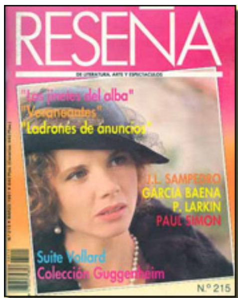
RESEÑA, 1991 NUM 215, pp. 26

Sábado, 27 de Marzo de 2010 18:44 - Actualizado Jueves, 29 de Abril de 2010 16:11