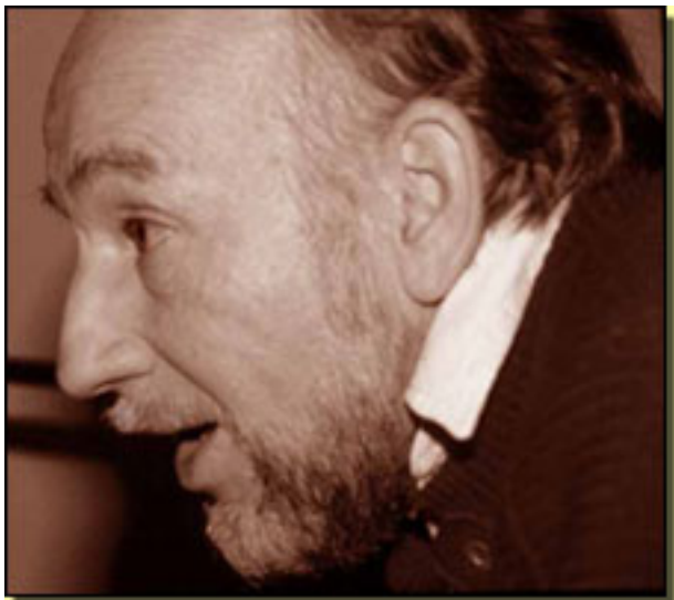
ADOLFO MARSILLACH

Sábado, 27 de Marzo de 2010 15:14 - Actualizado Sábado, 27 de Junio de 2020 16:37