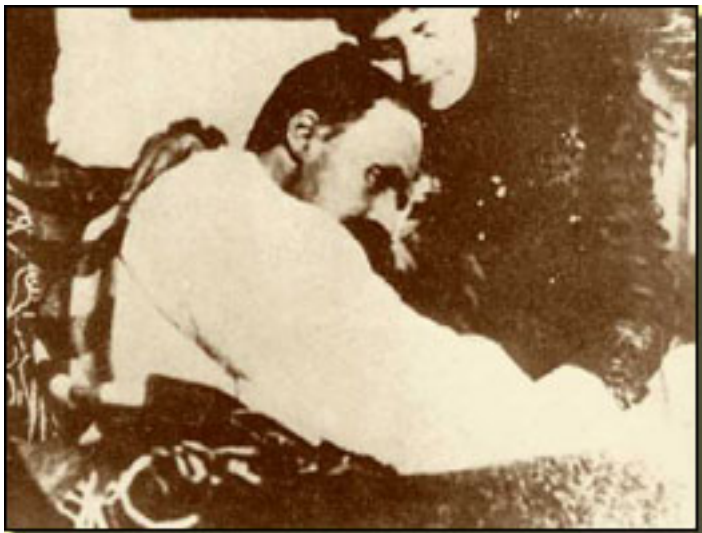
NIETZSCHE Y SU HERMANA