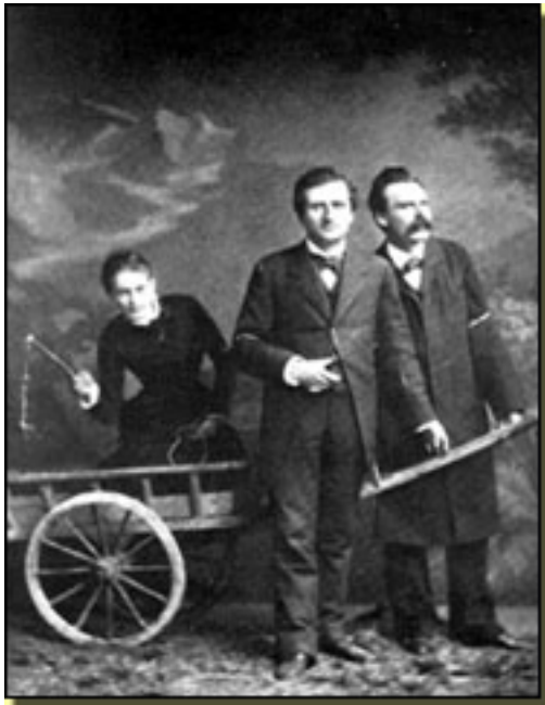
LOU/ PAUL REE/NIETZSCHE

- Esta combinación que hay en Nietzsche – confiesa Torregrosa – entre las ideas y el corazón es lo que más me llamó la atención. Sus ideas eran para 200 años después. Tiene que ser muy duro que tengas una idea y no te respondan. Es lo que le sucede a los incomprensidos. Estar abocado a la libertad y no encontrar respuesta debe ser terrible.