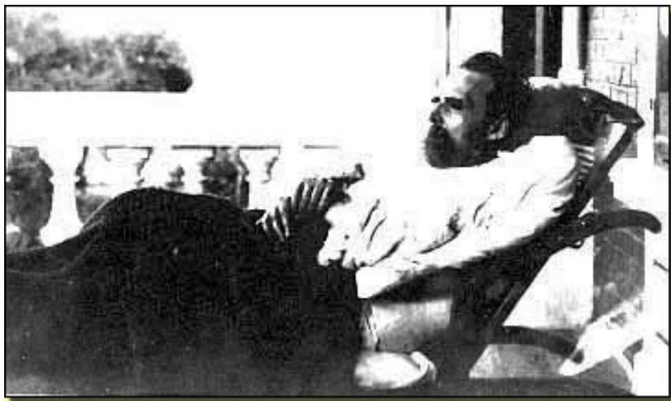
NIETZSCHE (ÚLTIMOS DÍAS)