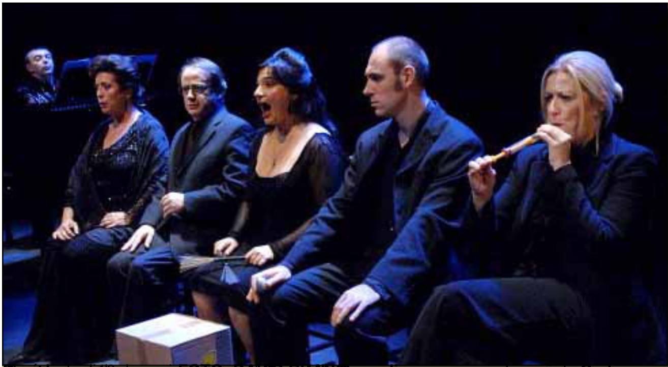
Carolee en el 16 de noviembre. Las Comedias es un acierto, señala Carlos

Viernes, 19 de Marzo de 2010 19:14 - Actualizado Viernes, 07 de Mayo de 2010 18:33