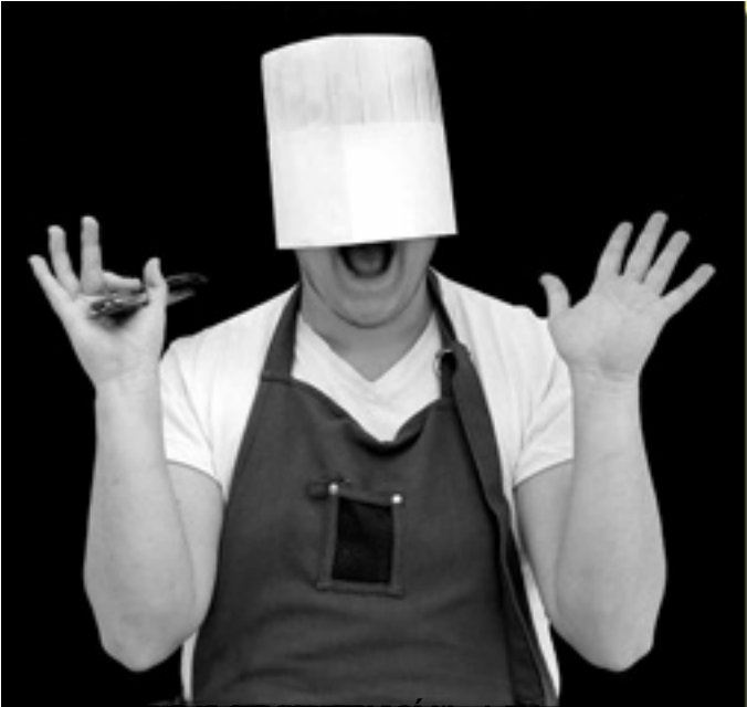
ya, todos los días, me busco (en el tablero) los platos (en

Viernes, 19 de Marzo de 2010 18:08 - Actualizado Lunes, 09 de Julio de 2018 19:18