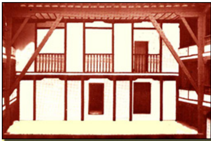
CORRAL DE COMEDIAS (S. XVII)

Viernes, 19 de Marzo de 2010 17:50 - Actualizado Jueves, 29 de Abril de 2010 15:20