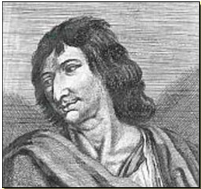
SAVINIEN DE CYRANO DE BERGERAC

Viernes, 19 de Marzo de 2010 17:46 - Actualizado Sábado, 24 de Abril de 2010 14:57