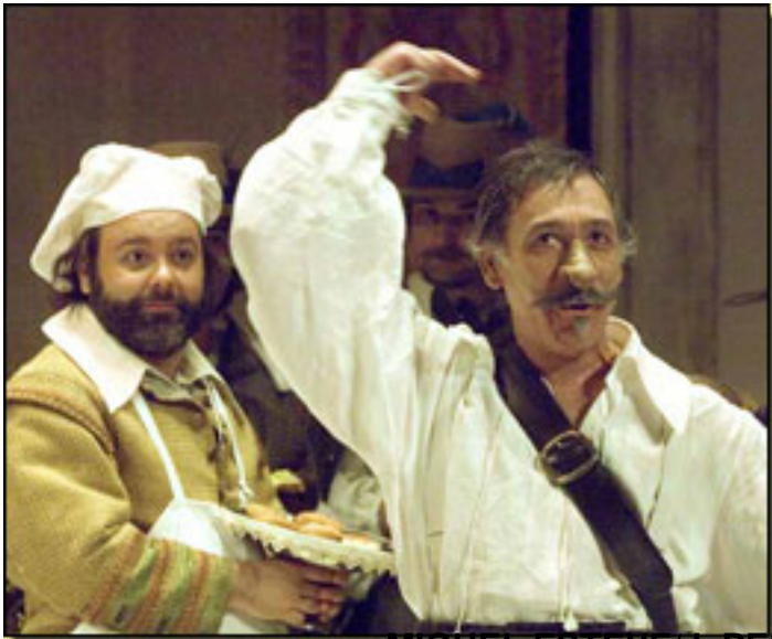
MIGUEL ESTEVE/J. PEDRO CARRIÓN

Viernes, 19 de Marzo de 2010 17:46 - Actualizado Sábado, 24 de Abril de 2010 14:57