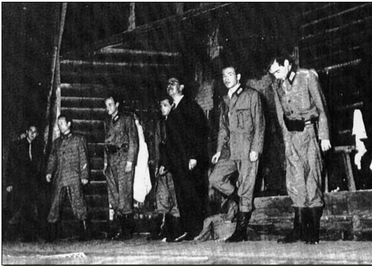
ESCUADRA HACIA MUERTE (1953) (Teatro María Guerrero)