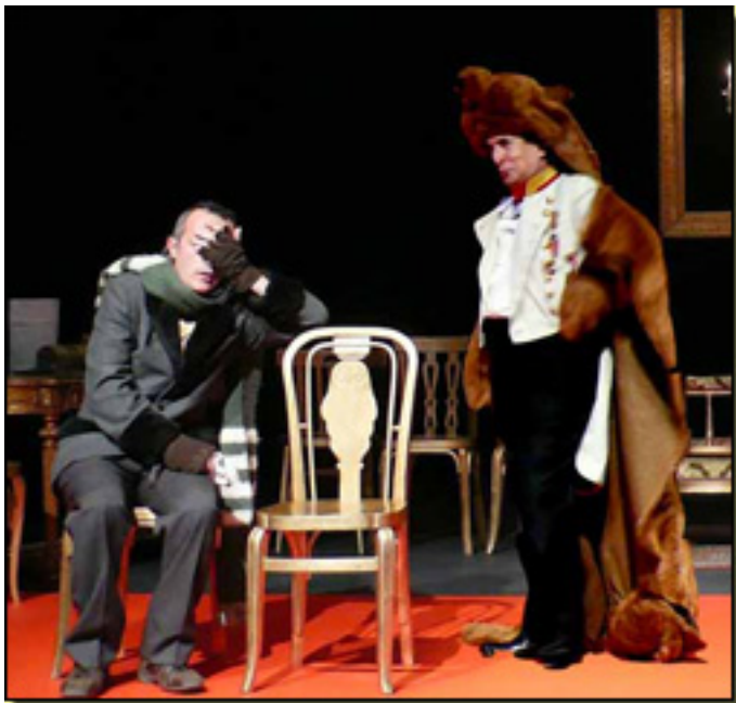
CHEMA RUIZ/FRANCISCO VIDAL