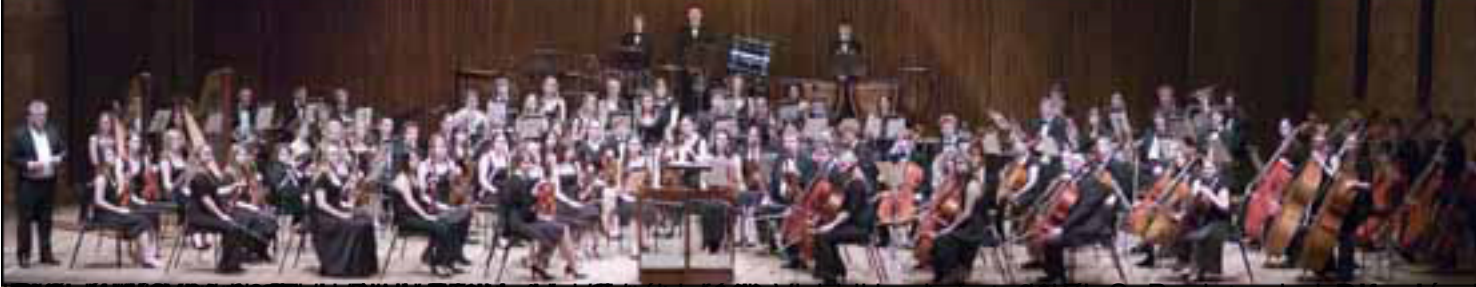
La Orquesta de Veranos de la Villa en un momento de su actuación.

El grupo de Veranos de la Villa, que se forma en la calle de la Villa de Madrid, es un grupo de músicos que se dedica a la interpretación de obras de los grandes compositores de la música clásica.