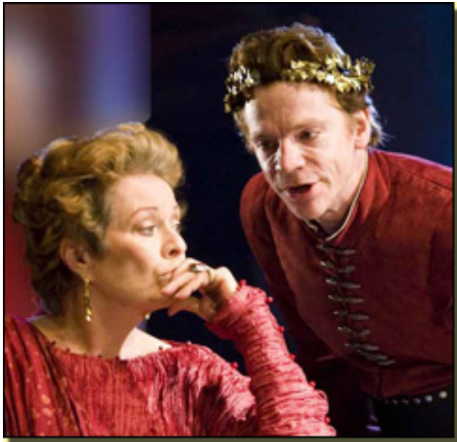
JANET SUZMAN/W. HOUSTON

Martes, 09 de Marzo de 2010 08:34 - Actualizado Jueves, 29 de Abril de 2010 17:46