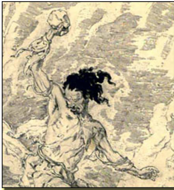
Cardenio (cap. Xxiv)

que para nosotros ha ll Shakespeare centro de nuestra literatura, se Shakespeare