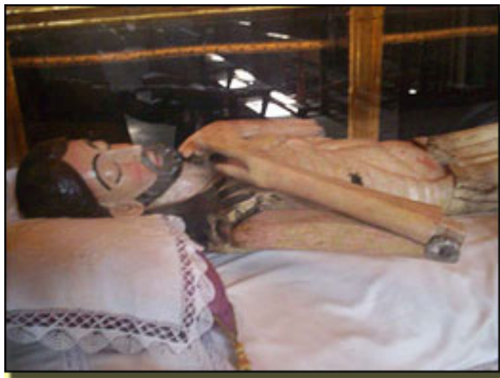
CRISTO DE LOS GASCONES, (Original)