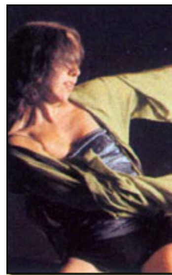
Es extraño que en la yema de nuestro dedo...

Espectáculo subvencionado por la Consejería de Cultura y Deportes de la Comunidad de Madrid