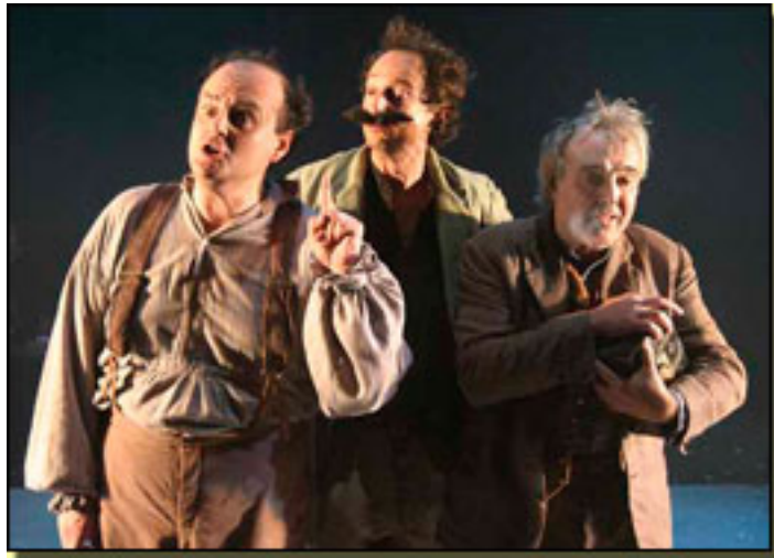
PACO VILA/BALBIN LACOSTA PACO ALEGRE

- La diferencia está en los comportamientos, es como jugar a dos juegos diferentes. Hay un cocktail hon