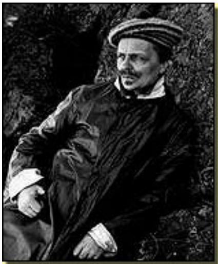
AUGUST STRINDBERG (ACTOR)

Miércoles, 17 de Marzo de 2010 20:39 - Actualizado Sábado, 24 de Abril de 2010 14:44