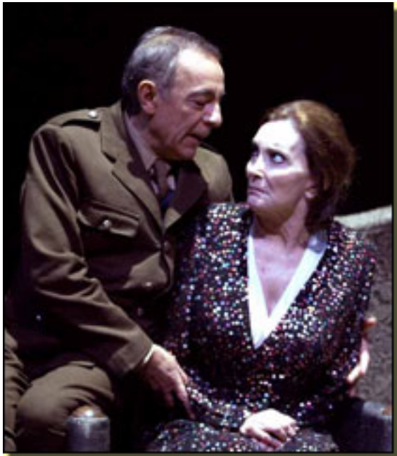
JOSÉ L. GÓMEZ/NURIA ESPERT

Miércoles, 17 de Marzo de 2010 20:39 - Actualizado Sábado, 24 de Abril de 2010 14:44