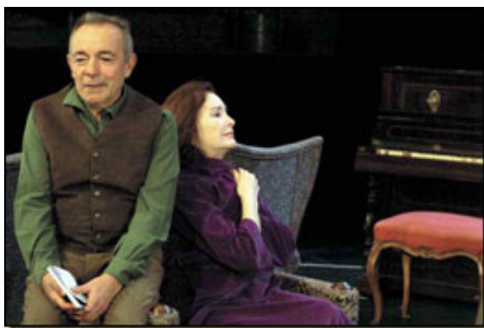
JOSÉ LUIS GÓMEZ/ NURIA ESPERT (ENSAYO)