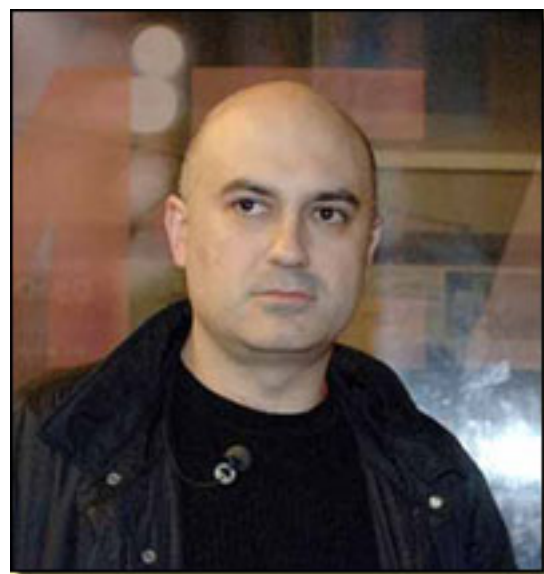
CALIXTO BIEITO

dejó disparar su imaginación y para nada le importó las coordenadas de espacio y tiempo.