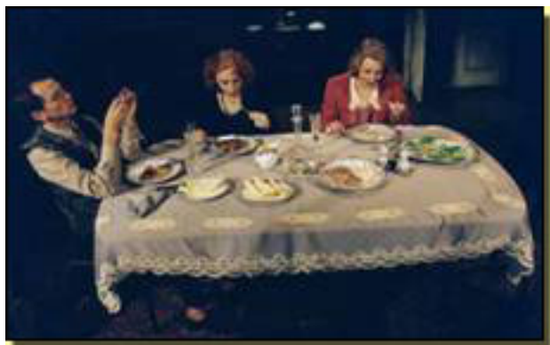
La obra se ha

En 1.994 fue Castro Viejo en Castro Viejo de la Compañía Gallega