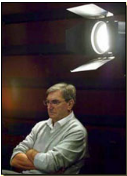
GEORGES LAVAUDANT

Sábado, 06 de Marzo de 2010 19:27 - Actualizado Sábado, 06 de Marzo de 2010 19:35