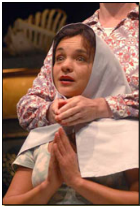
Oskaras Korsunovas