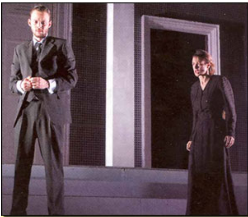
ELOY AZORÍN /EMMA SUÁREZ