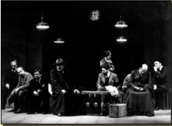
LA VELADA DE BENICARLÓ (1980)

Lunes, 15 de Marzo de 2010 16:26 - Actualizado Martes, 27 de Abril de 2010 16:43