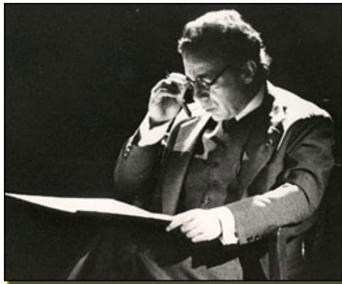
AZAÑA, UNA PASIÓN ESPAÑOLA (1988)