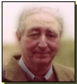
Jerónimo López Mozo copyright©lópezmozo

belleza, en las que las palabras parecen arrancas de un poema. ■