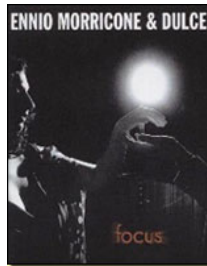
DULCE PONTES ■

BOLSILLOS Concierto en directo de su nuevo disco