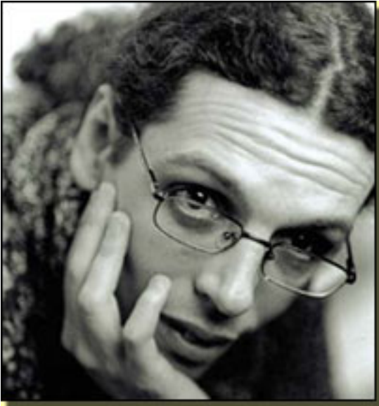
PEDRO GUERRA ■

BOLSILLOS Concierto en directo de su nuevo disco