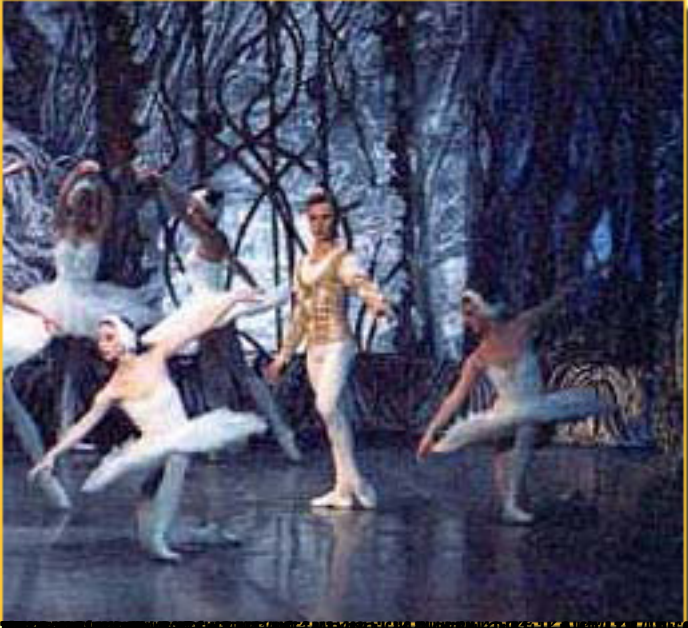
1913, por G. Sigel

Jueves, 25 de Marzo de 2010 18:18 - Actualizado Miércoles, 12 de Mayo de 2010 15:18