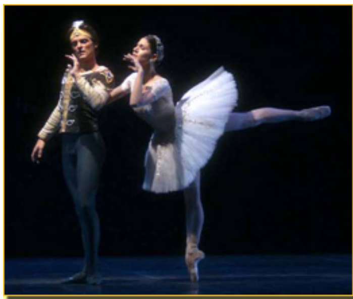
LA BAYADERA 2008