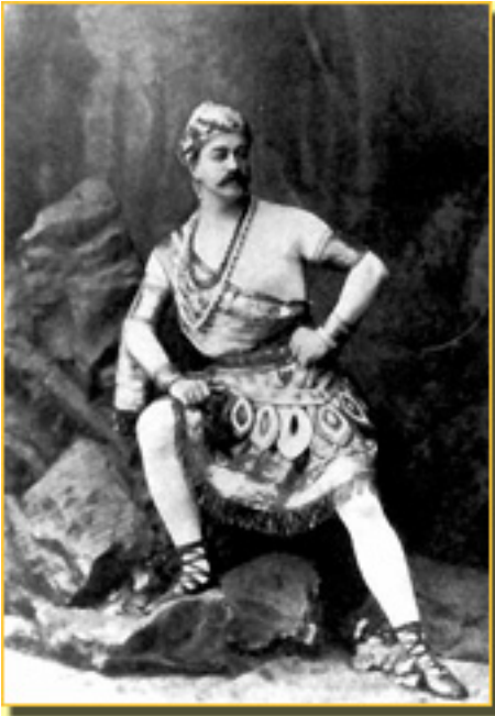
LA BAYADERA , (SEVORANOV

Sábado, 20 de Marzo de 2010 15:29 - Actualizado Jueves, 13 de Mayo de 2010 06:49