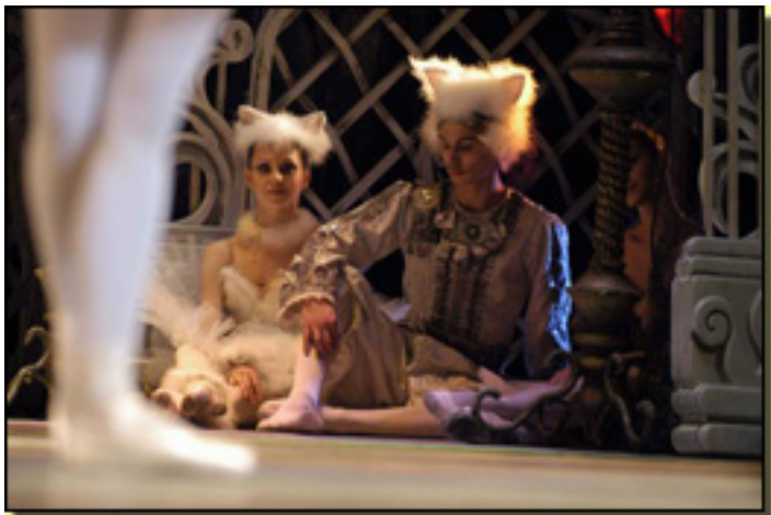
LA BELLA DURMIENTE

Lunes, 22 de Marzo de 2010 11:51 - Actualizado Martes, 11 de Mayo de 2010 15:36