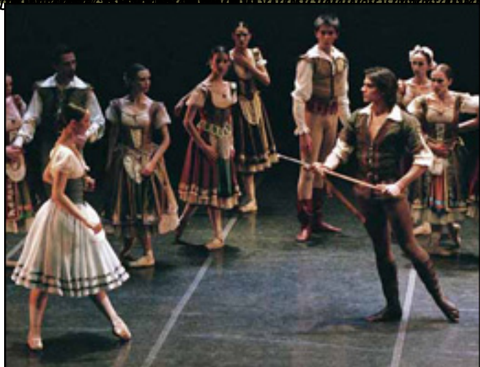
RECUPERACIÓN DEL BAILLET CLASICO EN EL BAILLET CLASICO COMO ARGUMENTO HA