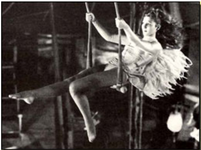
EL CIELO SOBRE BERLÍN (1987)