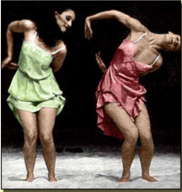
TANZEBEND II (1991, MADRID CULTURAL)