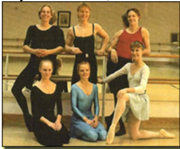
1989: Cuerpo de Baile de The Royal Swedish Ballet.

■ En el catálogo que Royal Swedish Ballet publicado en 1989, con Johan Inger una de sus artistas