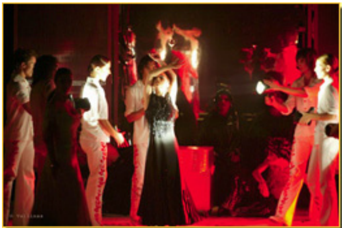
EL AMOR BRUJO

Domingo, 14 de Marzo de 2010 14:09 - Actualizado Martes, 11 de Mayo de 2010 16:30