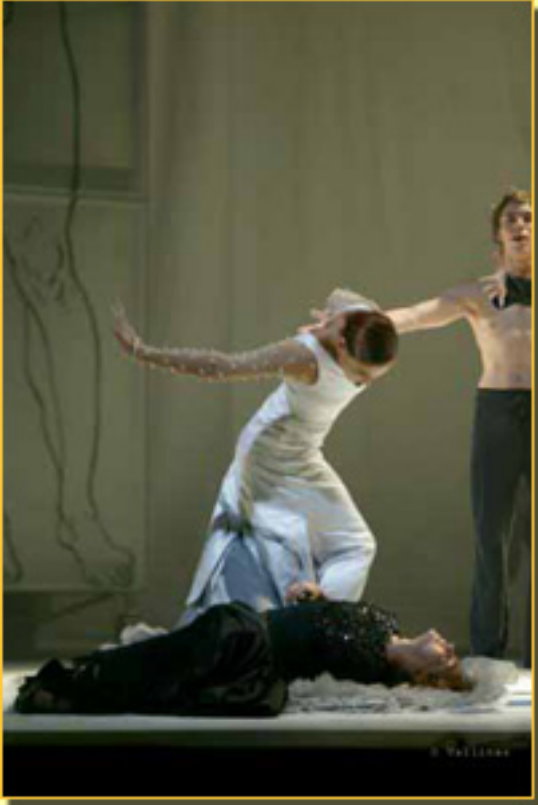
EL AMOR BRUJO

Domingo, 14 de Marzo de 2010 14:09 - Actualizado Martes, 11 de Mayo de 2010 16:30