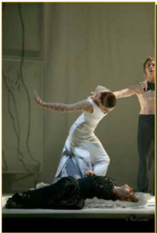
EL AMOR BRUJO

Domingo, 14 de Marzo de 2010 14:09 - Actualizado Martes, 11 de Mayo de 2010 16:30