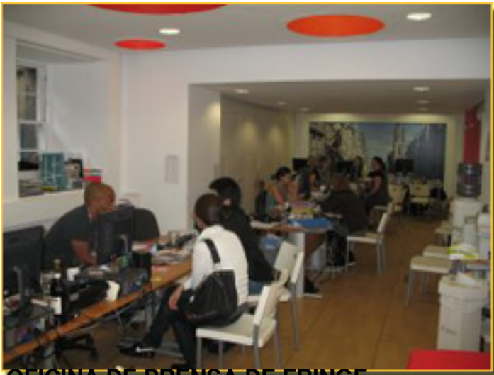
OFICINA DE PRENSA DE FRINGE

Domingo, 14 de Marzo de 2010 12:37 - Actualizado Martes, 11 de Mayo de 2010 16:40