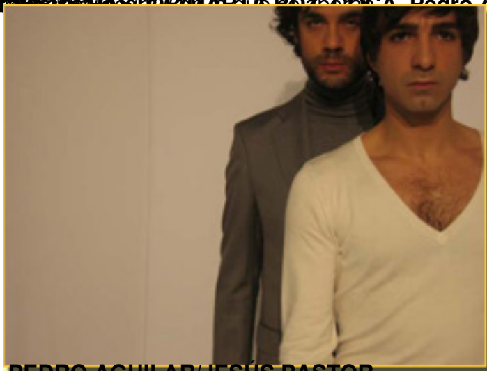
PEDRO AGUILAR/JESÚS PASTOR

Esta obra está sujeta a una licencia de atribución por derechos de autor. Para más información, visita http://www.creativecommons.org/licenses/by/3.0/