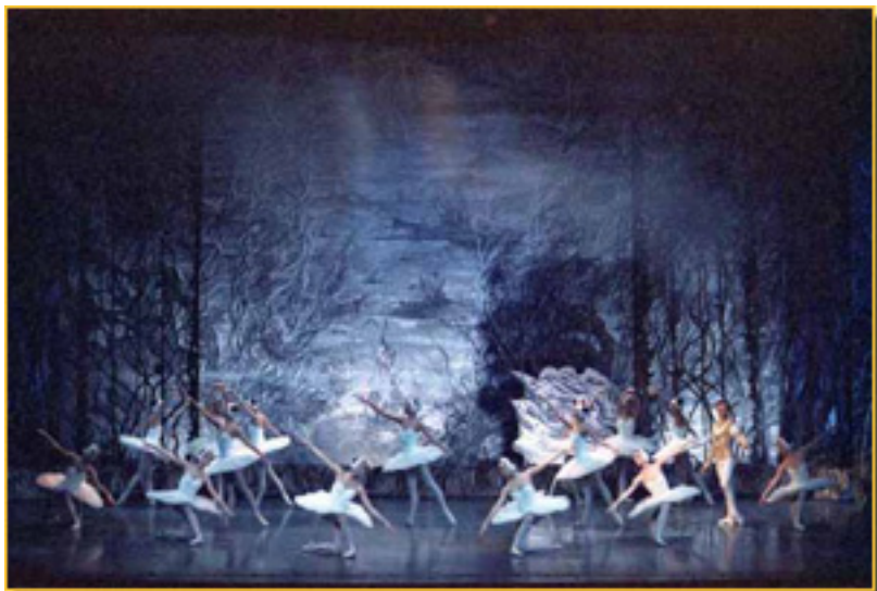
EL LAGO DE LOS CISNES