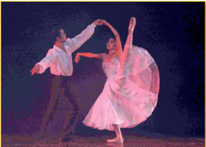
LA MÚLTIPLÉXICA - VIA GEMINIDAS TARANDA

Domingo, 14 de Marzo de 2010 07:28 - Actualizado Martes, 11 de Mayo de 2010 17:26