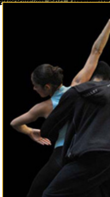
Región de Madrid - Ballet de España - Compañía Nacional de Danza - Francia - Palacio de la Zarzuela - 2003 - Entre el cielo y la tierra